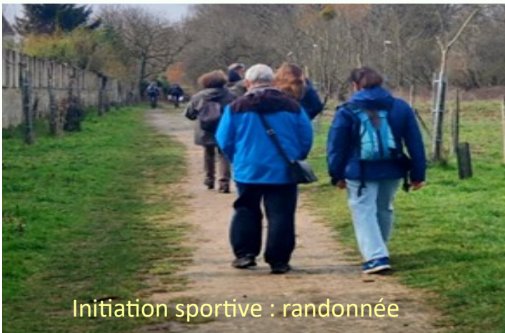
Initiation sportive : randonnée