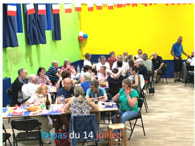
Repas du 14 juillet