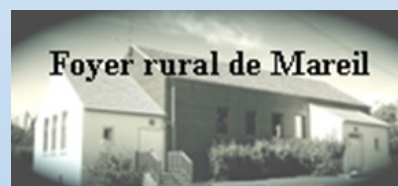
Foyer rural de Mareil