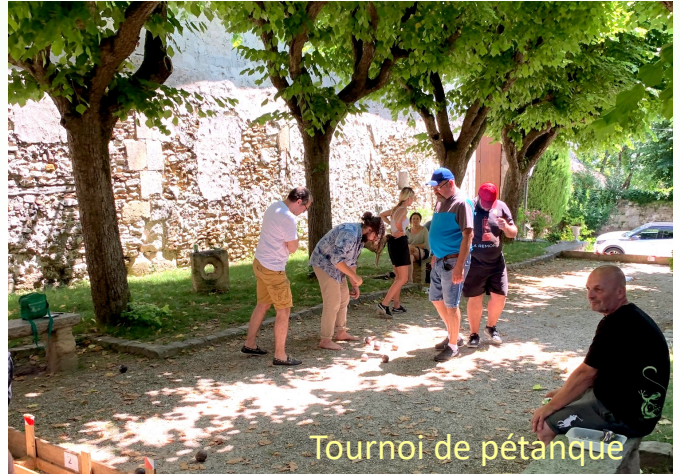
Tournoi de pétanque