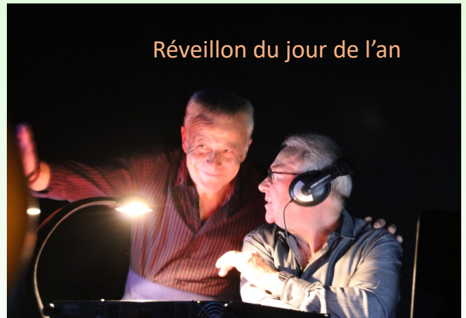
Réveillon du jour de l'an